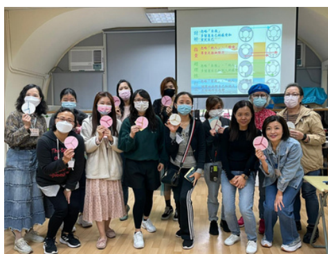
認識你的應對衝突模式