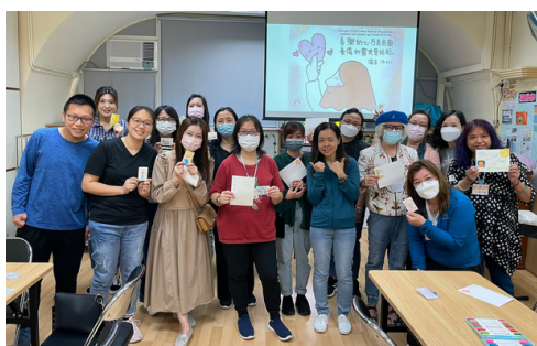
跟「思想陷阱」說再見