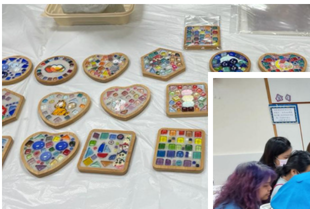
獨特的我 - 馬賽克手工

2023年3-4月，我們繼續邀請橋路通的姑娘舉行「美善家長工作坊」，工作坊的內容十分適切現今家長的需要。過程中，亦喜見家長不同的分享。