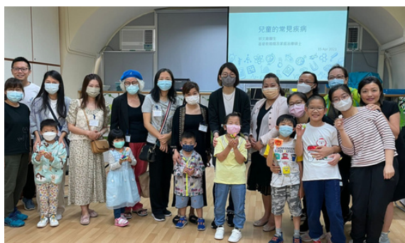
小兒常見疾病與預防